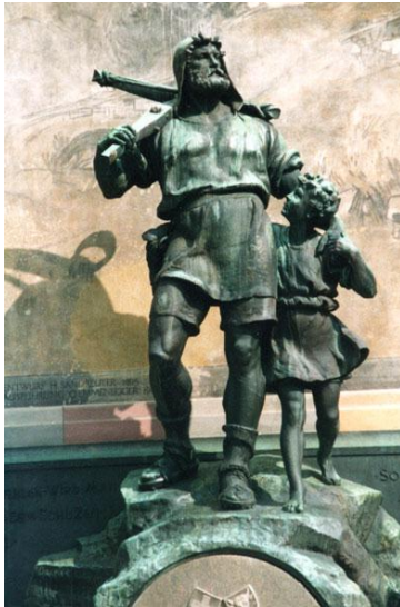
A Altdorf, à côté du monument de Tell