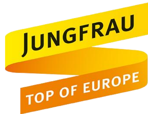
A la gare du chemin de fer de la Jungfrau